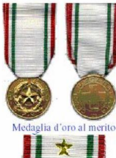
Medaglia d'oro al merito