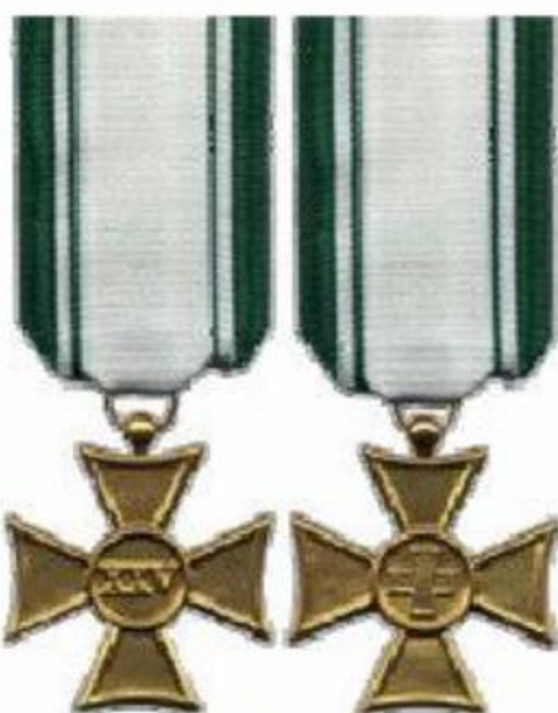
25 anni di anzianità (placcata in oro)