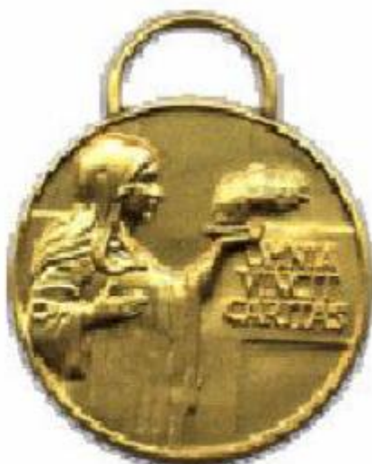
Medaglia di benemerenzza di 2° classe