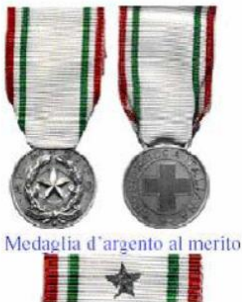
Medaglia d'argento al merito