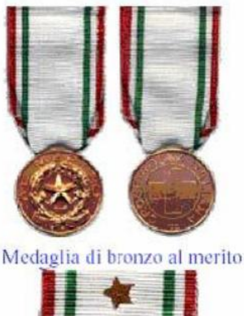
Medaglia di bronzo al merito