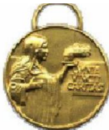
Medaglia di benemerenzza di 3° classe